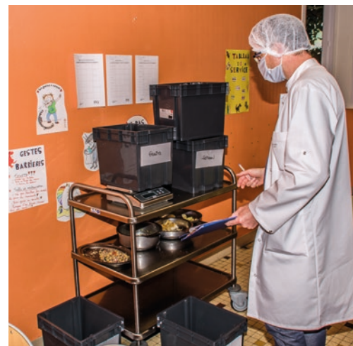
Pesages réalisés pour connaître la quantité de déchets produits.