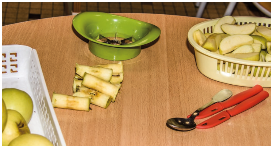
Fruits préparés à la demande.