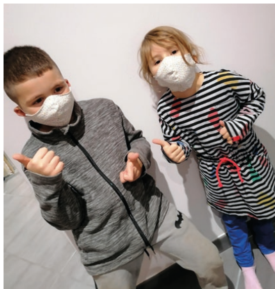
Au service municipal enfance jeunesse, les plus jeunes ont apprécié les masques en tissu réalisés par l'atelier des petites mains.

Si toutefois vous rencontrez des difficultés pour vous déplacer, merci de bien le préciser lors de l'inscription.