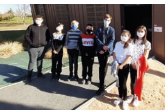
Les collégiens de Gerzat ont présenté leur projet et leur implication dans le domaine E3D sur les ondes de Radio Arverne en fin d'année 2020.

Plusieurs actions sont prévues cette année, comme une « éco randonnée » avec l'association sportive du collège, une sensibilisation à l'économie sociale et solidaire en partenariat avec des entreprises locales (Envie MO et Biau Jardin) et une collecte alimentaire au profit du Secours populaire.