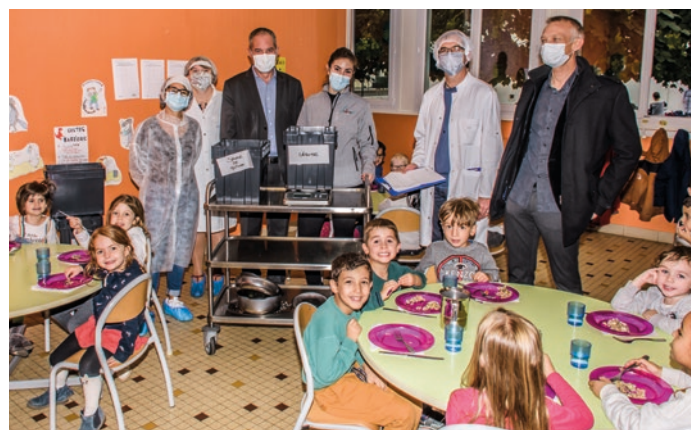
Des actions portées par un engagement de la municipalité en matière de transition écologique.

La mise en œuvre de cette démarche collective menée avec les équipes et les enfants offrira à chacun la possibilité de prendre conscience de son impact sur l'environnement et des leviers qui sont à sa disposition pour changer cela.