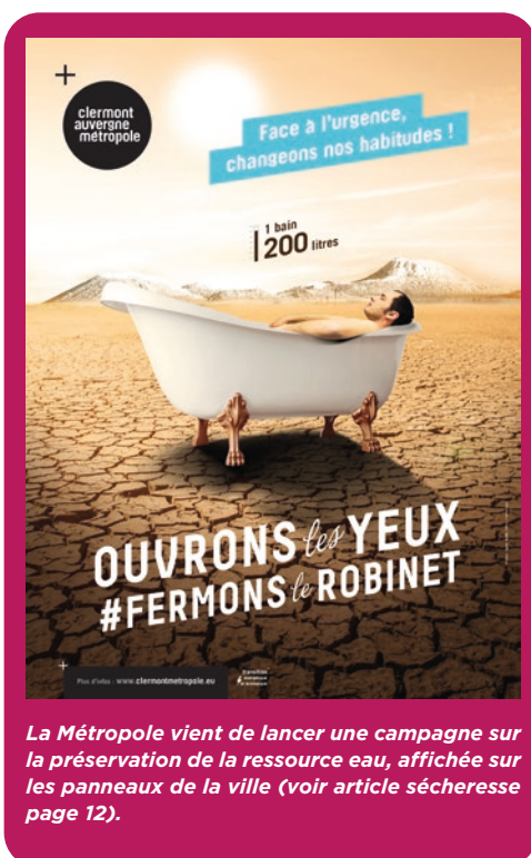
La Métropole vient de lancer une campagne sur la préservation de la ressource eau, affichée sur les panneaux de la ville (voir article sécheresse page 12).

Les horaires de chaque site ont également évolué ; la déchetterie de Gerzat est ainsi ouverte du lundi au samedi de 9h30 à 12h et de 15h à 17h30.