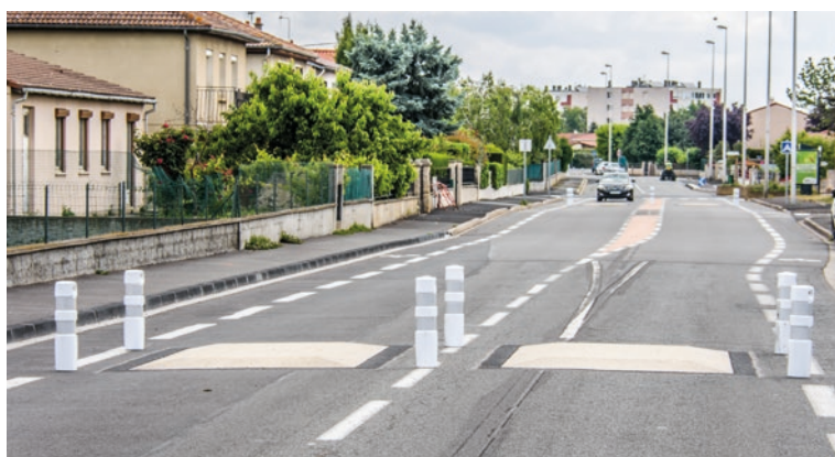
Rue Marius Michel.