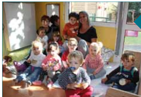
Les « grands » anciens du Magicabou

Les enfants déjà présents sur la structure ayant grandi de 3 semaines, ont quant à eux rapidement retrouvé leurs repères et la vie des différents groupes s'est ainsi très vite organisée. Le travail de réflexion mené depuis 10 ans continue à porter ses fruits. Les enfants nous montrent à quel point le cadre offre toute la stabilité et la sécurité affective dont ils ont besoin pour se sentir en confiance auprès d'adultes bienveillants qui les accompagnent sur le chemin de l'autonomie.