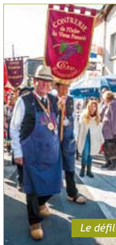
Le défilé des Confréries