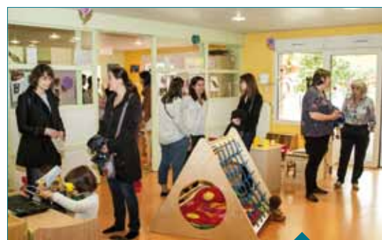
Matinée portes ouvertes pour les 10 ans du Magicabou