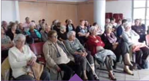
La conférence sur le thème « sécurité/bien chez soi » était organisée en partenariat avec la Police municipale de Gerzat