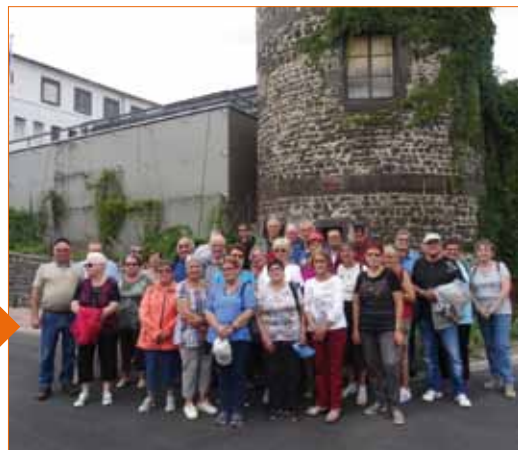
Le groupe « promenade » Gerzat