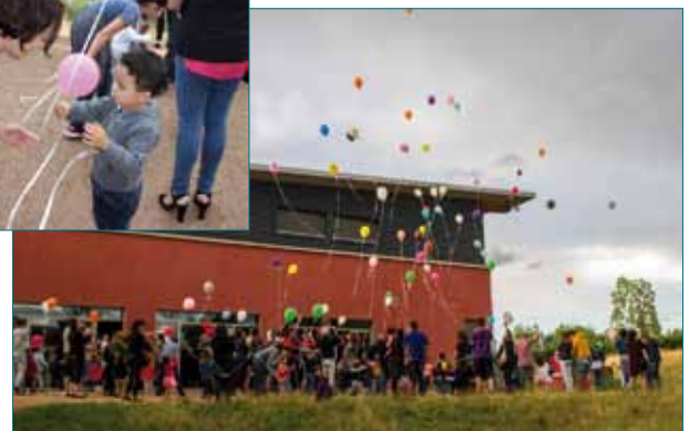
Spectacle et lâcher de ballons en juin au Galion pour les 10 ans du Magicabou avec un public nombreux