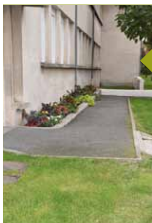
Nouvelles plantations réalisées allée Antony Bardin