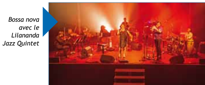
Bossa nova avec le Lilananda Jazz Quintet