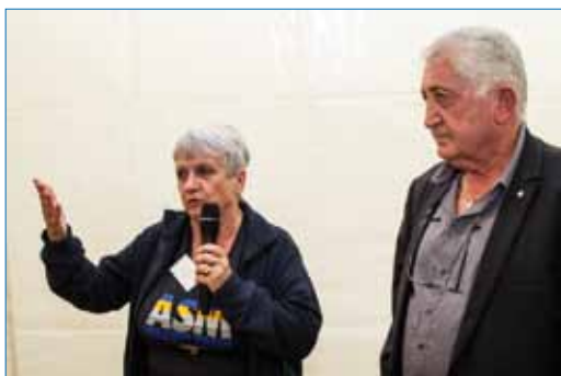
Retour en images sur le 1 er Forum des associations

Une rencontre conviviale dont la 2 ème édition se déroulera en septembre prochain