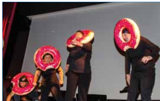
Ouverture de la saison culturelle en partenariat avec la troupe des Ateliers du Caméléon

Si vous avez manqué cette présentation, retrouvez tous les rendez-vous sur le programme disponible à l'accueil de la mairie, sur le site internet de la ville : www.ville-gerzat.fr , la page Facebook / Saison culturelle de la Ville de Gerzat ou auprès du service municipal de l'action culturelle à La Vague.