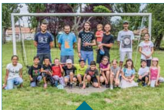
Le tournoi de foot avec les habitants du quartier : victoire de l'équipe des enfants du quartier parmi les 3 équipes engagées dans la compétition