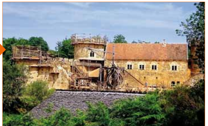
Visite du château de Guedelon

Les adhérents ont repris leurs activités dès le mois de septembre avec la découverte du parcours historique de Gerzat commenté par le Président de l'association Racines Gerzatoises.