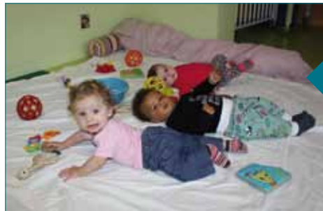
Les « petits » nouveaux du Magicabou

Un nouveau cycle d'accueil a débuté le 22 août pour les enfants du « Magicabou ». On compte parmi eux 21 « petits nouveaux ». Ces enfants ont débuté leur accueil par une période d'adaptation qui leur a permis progressivement de faire connaissance avec la personne « référente » puis de se familiariser avec un nouvel environnement.