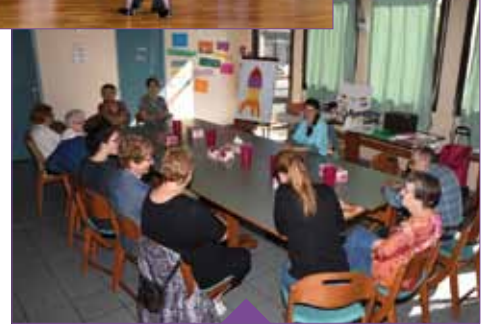
L'atelier bien-être clôturait la semaine bleue