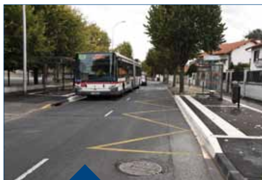
Rénovation et mise aux normes accessibilité par le Syndicat Mixte des Transports en Commun (SMTC) de 4 arrêts de bus : rue sous les Ors, rue Jules Ferry, rue Gambetta et rue Jean Verney