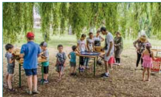
Livres en libre-service avec les bibliothécaires du bassin de lecture Nord, pour le bonheur des grands et des petits

Ce temps convivial a été très apprécié et a clôturé de la meilleure des manières cette semaine forte en animations.