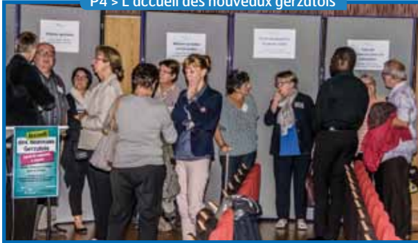
P4 > L'accueil des nouveaux gerzatois