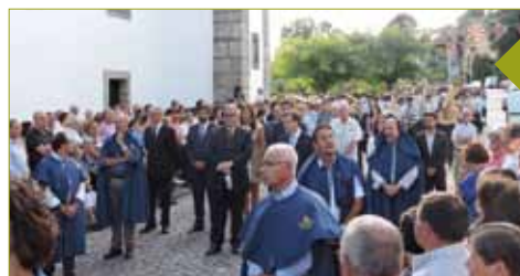
Accueil de la délégation gerzatoise aux festivités locales par les élus portugais de Taïde et de Povoá de Lanhoso