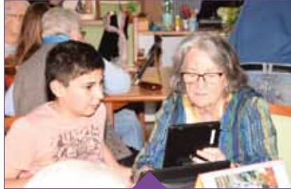
Rencontre intergénérationnelle avec les enfants du Service Municipal Enfance Jeunesse