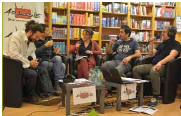
L'équipe de RADIO ARVERNE à la librairie LES VOLCANS lors de l'édition 2017 du « Festival International du Court Métrage »