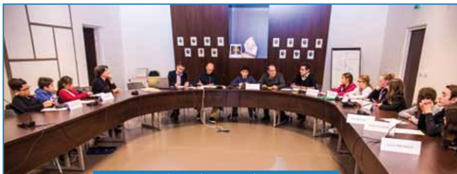
P6 > Une 1 ère année d'activité pour le CMJ