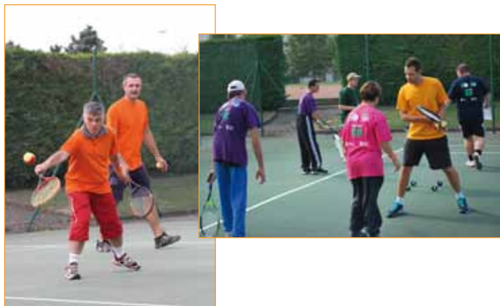
Du côté des jeunes

Rendez-vous vendredi 22 septembre au complexe Georges Fustier pour une prochaine rencontre tennistique.