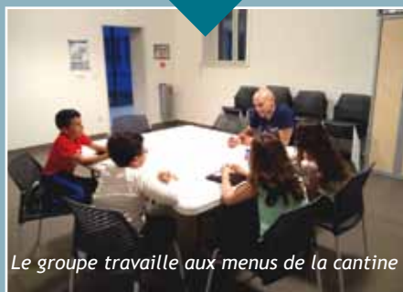
Le groupe travaille aux menus de la cantine

Le premier repas s'est déroulé le 13 avril sur le thème de l'Auvergne. Les activités du CMJ et des trois autres groupes sont détaillés en rubrique Ville.