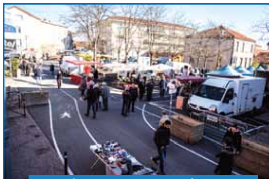
P5 > Réorganisation des marchés gerzatois