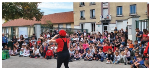
Le spectacle Au pays enchauté de la Cie les chats mots passant ont ravi les enfants.

Le Vétathlon de la pansette du Vélo Sport Gerzatois a rassemblé plus de 70 participants avec la 2 ème édition d'un vétathlon enfants 7/15 ans (détail en page 21).