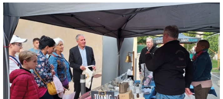
Visite des stands à l'occasion de l'inauguration de la Foire aux pansettes.

N'hésitez pas également à rejoindre la sympathique équipe du Comité des Fêtes Gerzatois en tant que bénévole.