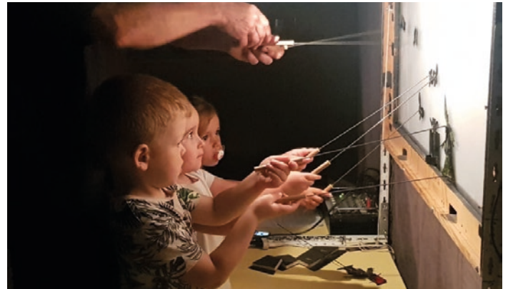
Spectacle et initiation aux jeux d'ombres avec la compagnie LES MONTREURS D'OMBRES.

Tous contribuent à proposer à chaque enfant et jeune de 0 à 17 ans un parcours éducatif cohérent et de qualité avant, pendant et après l'école.