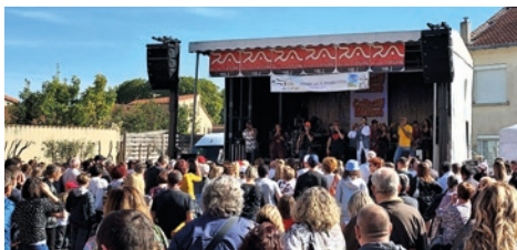
Les concerts ont rassemblé un public nombreux.