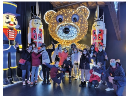
Les jeunes élus se sont rendus en mars au showroom de Cré-Light illuminations pour choisir les prochaines lumières de ce rendez-vous.

Le Conseil Municipal des Jeunes (CMJ) et les enfants inscrits au SMEJ organiseront la 5 ème édition du Rendez-vous des Illuminations le mercredi 7 décembre à partir, 17h30 Place Pommerol. La nouvelle illumination choisie par le CMJ sera inaugurée ce jour. Déambulation, marché et animations agrémenteront également ce rendez-vous festif.