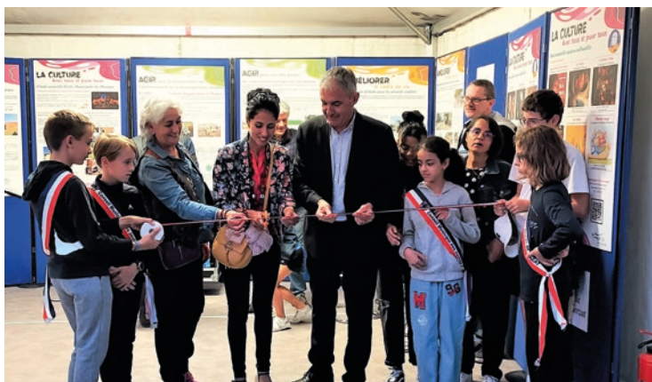
Inauguration de la Foire aux pansettes avec le Conseil municipal jeune.

Exposants et visiteurs ont été au rendez-vous pour la traditionnelle Foire aux Pansettes les 7, 8 et 9 octobre avec le Comité des Fêtes Gerzatois. Le spectacle pour enfants de la Cie Les chats mots passant, les prestations et initiations des clubs de danse Tango Ardiente, Bottes Blues et AWUC (country), les spectacles-concert de l'orchestre No Name et du Collectif Métissé, le clown Valezic et les Paladins de la Pansette, ont animé les rues de la ville durant le week-end.