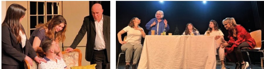
« Si on recommençait » de Éric Emmanuel Schmidt le 24 juin « Tous mes rêves partent de gare d'Austerlitz » de Mohamed Kacimi le 25 juin

Le théâtre de l'Horloge s'est produit au théâtre Cornillon en juin avec deux pièces :