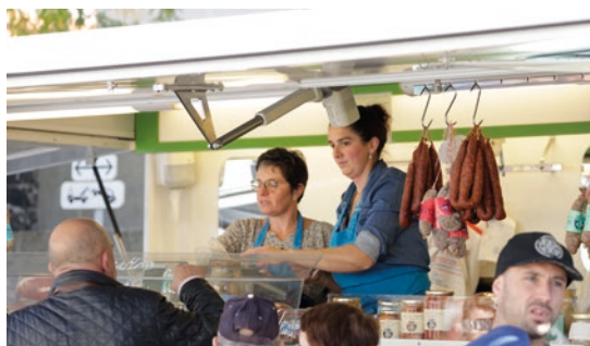
De nombreux exposants de produits du terroir.