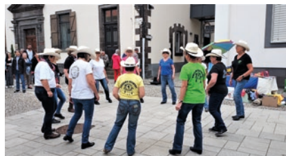
Animations country dans les rues.